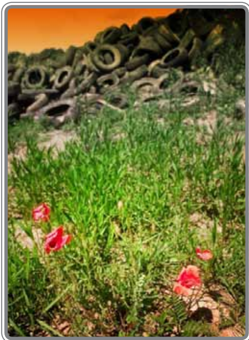
Thanaszisz Tepfenhart díjnyertes fotója az ádándi rallycross pályáról

Ne dobjunk bele zsíros, olajos, háztartási vegyi anyaggal szennyezett (nem kimosott) flakont. Tejes, joghurtos poharat, margarinos dobozt, élelmiszer-maradványt tartalmazó műanyagot, hungarocellt, CD-lemezt, magnó- és videokazettát, egyéb műanyagot ítélt hulladékot (pl. nejlonszál), mert hasznosításuk jelenleg nem megoldott!