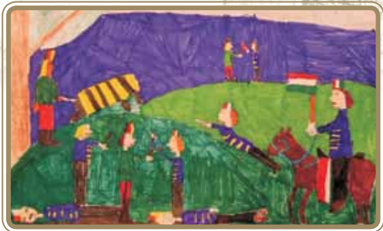
Kutacs Vivien 3. o.