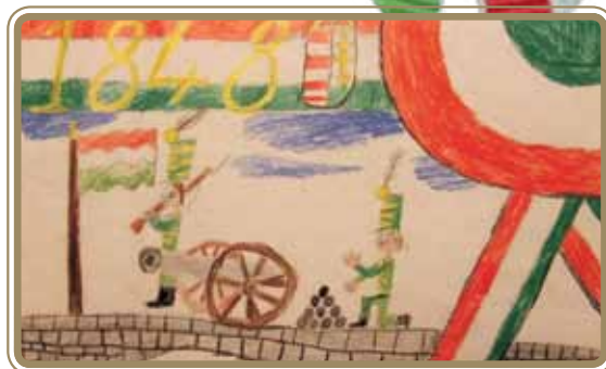
Virághalmi Kristóf 4. o.