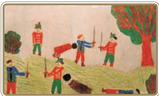
Sipiló Jázmin 3. o.